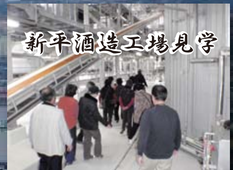
新平酒造工場見学

インターネットで人気の民宿村（志布志市有明）に宿泊します。蓬の郷温泉すぐ近く、秋の夜長を堪能ください。