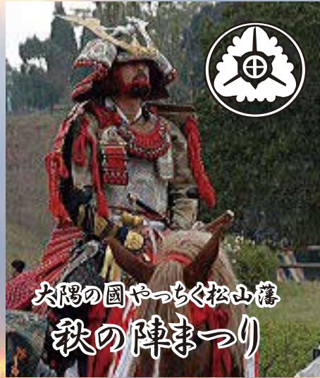
大隅の国やちく松山藩 秋の陣まつり